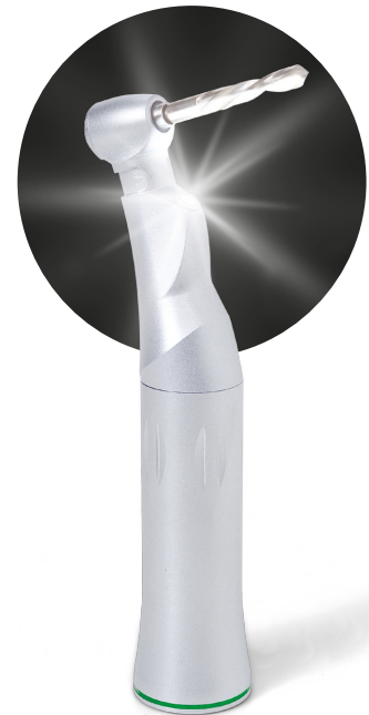
20 : 1 LED-Winkelstück