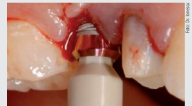
Das neue TRI-OCTA Tissue Level Implantat mit gingivafarbener 1,8mm Tulpe.